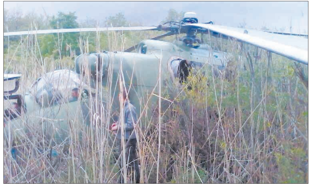
Збитий український вертоліт Мі-24 оглядають проросійські бойовики

– Ці були ще агресивнішими, одягнуті в цивільний одяг. Забрали телефон, доку-